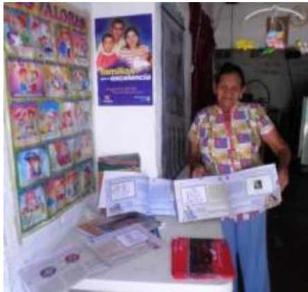
MULTIPLICADORAS FAMI GALAN