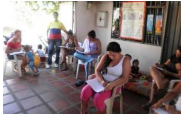
REUNION EVALUACION GRUPO MULTIPLICADORA FAMI GALAN