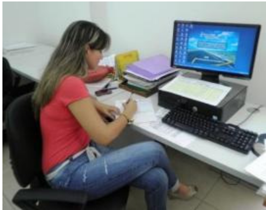
CENTRO ZONAL ICBF LA GAITANA