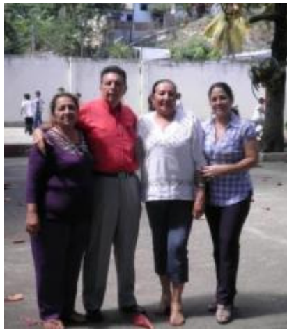
DIRECTIVOS Y DOCENTES MANUELA BELTRAN