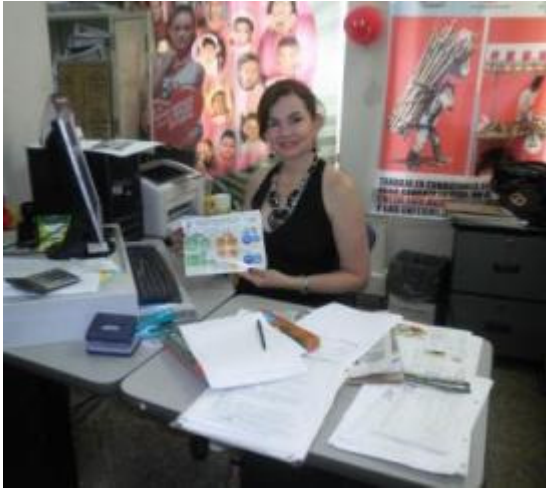
SECRETARIA DE SALUD MUNICIPAL