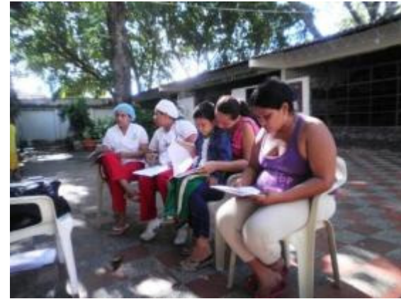
MADRES USUARIAS EVALUANDO EL PROGRAMA