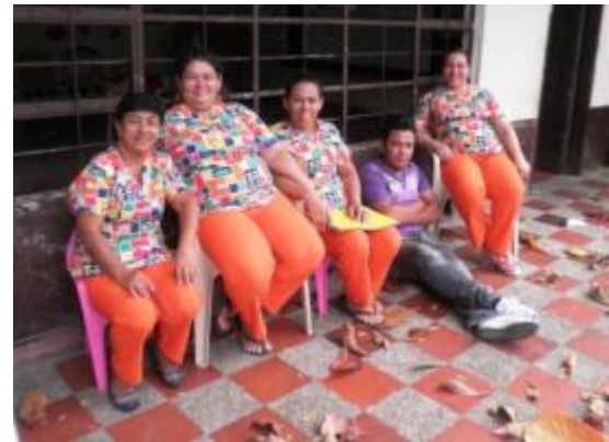
MADRES COMUNITARIAS BARRIO GALAN