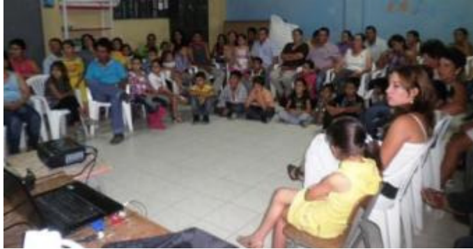
REUNION CLAUSURA ICDP EN DINDAL