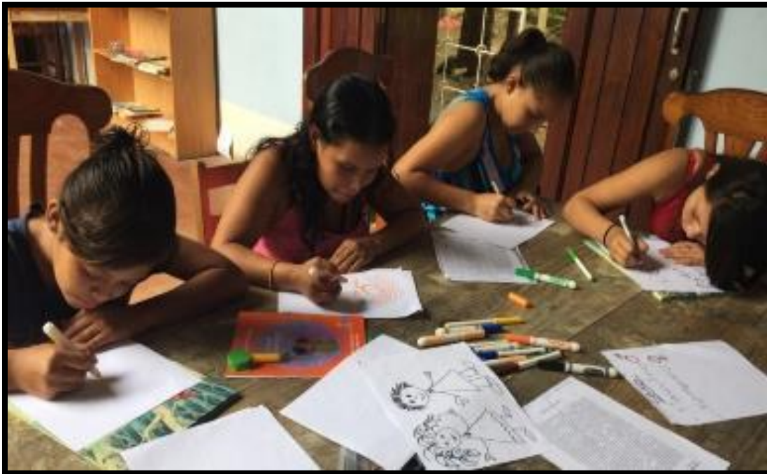
Sesiones con adolescentes con la Metodología ICDP