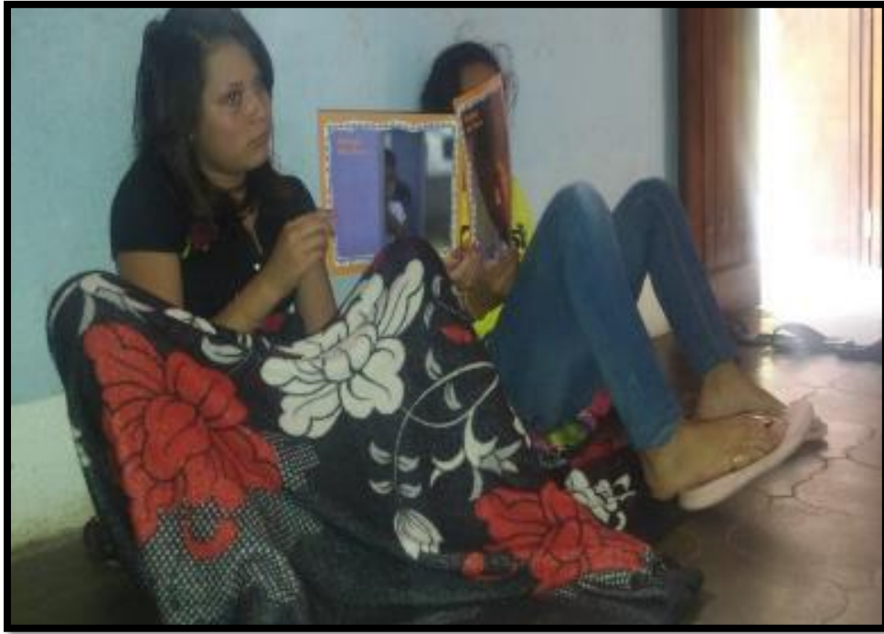
Intervenciones con Adolescentes con la Metodología ICDP