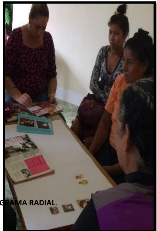
DIVULGACIÓN DE ICDP EN PROGRAMA RADIAL.